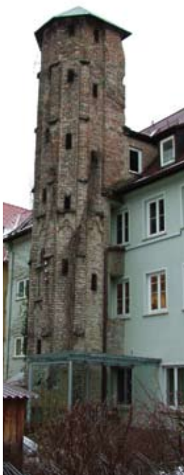
Innenhof: Der Turm des Zehntstadels des Wengenklosters