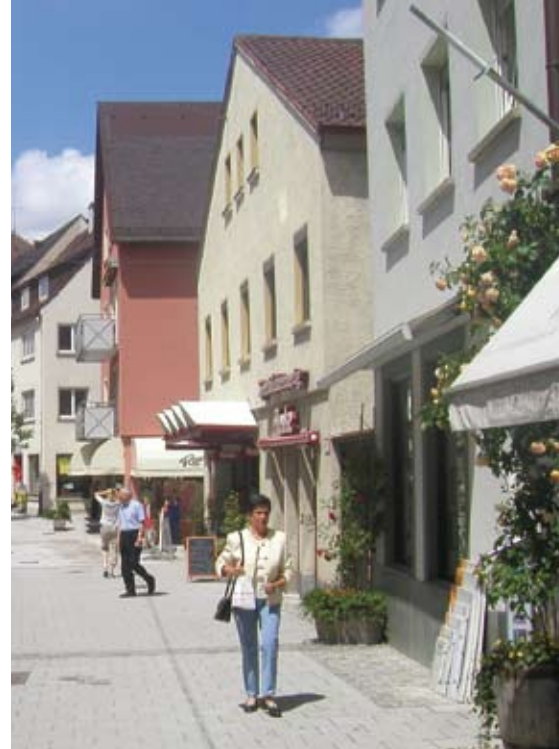
Sommeransicht: Die Walfischgasse blüht