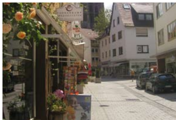
Innenstadtidylle: Blick Richtung Münster