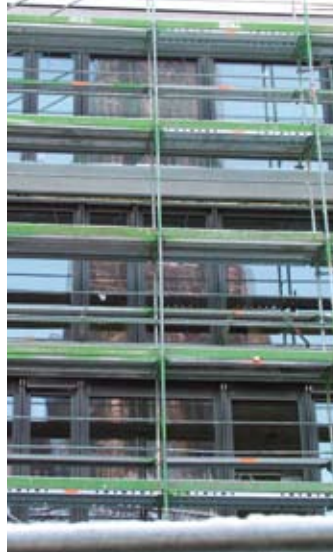
Spiegelbild: Alt und Neu vereint