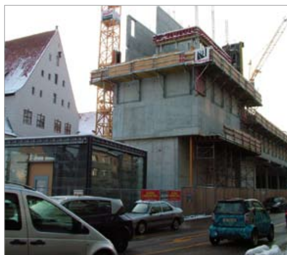
Ansehen: Die Sammlung Weishaupt entsteht