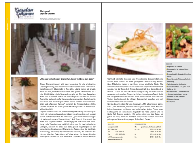
Ein Blick ins Buch: So kann ein Firmenporträt aussehen

AB JUNI GIBT ES DAS HANDBUCH »ULM UND NEU-ULM FEIERT!« – FÜR ALLE DIE EINE PRIVAT- ODER FIRMENFEIER, EINE HOCHZEIT ODER EINEN KINDERGEBURTSTAG, EIN INCENTIVE ODER EIN KUNDEN-EVENT PLANEN, DAS PERFERTE KOMPENDIUM