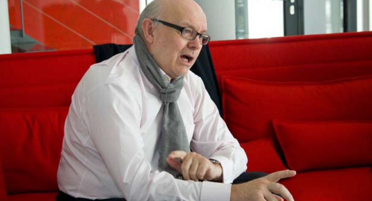
Langjähriger Manager von Falco: Kann auch mit Starallüren umgehen