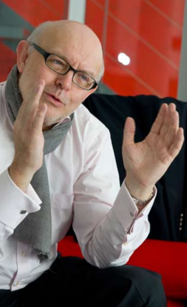
Mag auch Fast Food: »Eine wunderschöne Currywurst ist etwas Großartiges.«

▶ Ich lese noch jede Woche »Billboard«, das ist eine liebe und zunehmend anachronistische Angewohnheit aus der Blütezeit des Musikgeschäftes. Es wird zunehmend weniger, weil sich die Proportionen im Geschäft verschieben. Grundlektüren wie Spiegel, Stern oder auch den Feinschmecker nimmt man gerne mit.