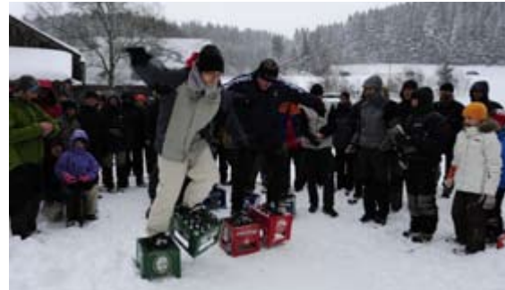
Hatten Spaß: Teilnehmer der »nordischen Olympiade«

Vom 29. bis 31. Januar fand erneut das alljährliche Wintertreffen des Outdoor-Ausstatters »Lauche und Maas« statt. Heuer berichten wir nicht nur in der grauen Theorie darüber – der SpazZ war an Ort und Stelle. Mit den über 300 Teilnehmern zusammen haben wir unser Durchhaltevermögen beim Extrem-Campen unter Beweis gestellt.