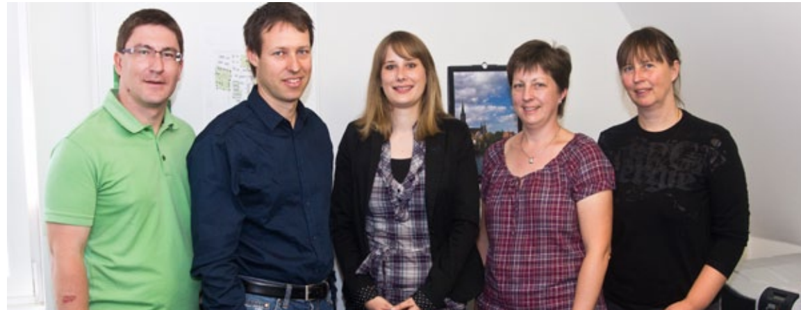
Das fünfköpfige Team „Bautechnik“ der UWS

Wenn Wohnungen neu gebaut werden, dann ist das Team Bautechnik kompetent bei der Sache: Hier wird jeder Neubau von Anfang bis Ende begleitet. Dies beginnt sogar beim Abbruch alter, bestehender Gebäude, reicht über die Durchführung von Architektenwettbewerben, die Planung und Vorbereitung von Bauvorhaben bis hin zur Realisierung und Bauleitung. Beim letzten großen Projekt wurden 64 Wohnungen in der Sedanstraße durch das Team Bautechnik betreut. Das Projekt „wohnen am Türmle“ hingegen ist derzeit in der Phase des Abbruchs. Die Planungen für den Neubau laufen auf Hochtouren, und sobald Baurecht erteilt wird, werden die Mitarbeiter täglich vor Ort sein, um die Baustelle zu betreuen.