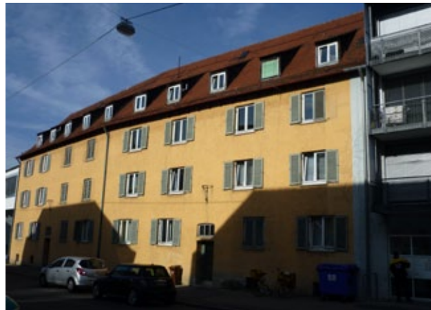
Der Neubau Sedanstraße 120/122: Das Wettbewerbsergebnis als Modell und Zeichnung (links) und das bisherige Gebäude, das in Kürze abgerissen wird